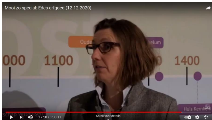
Print screen van het interview voor MOOI ZO! 12-12-2020