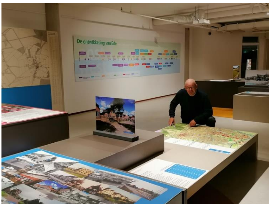
Expositie Ede in Ontwikkeling

Expositie Gelderland, de Tweede Wereldoorlog in vijftig foto's November 2020 – 1 april 2021