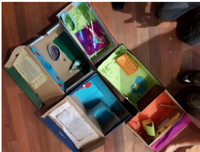
De ontworpen straten in de kijkdoos door de deelnemers

Tijdens de herfstworkshop gingen de kinderen een kijkdoos maken waarin ze hun eigen straat of hun droomstraat gingen ontwerpen. De workshop was in het kader van de expositie 'Ede in Ontwikkeling van Oost naar west'. Er deden in totaal 7 kinderen aan mee.