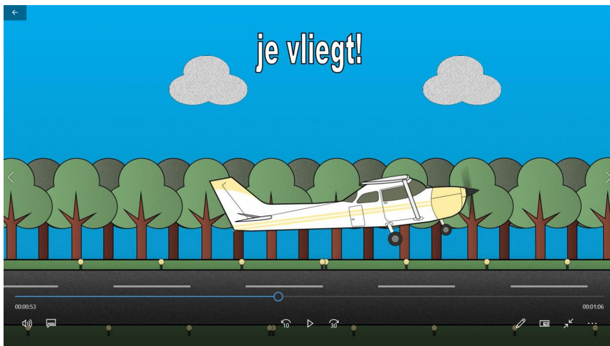
Print screen uit de animatie 'Hoe vliegt een vliegtuig' voor de educatie The Flying Dutchman

Het lespakket 'the Flying Dutchman' was aan een upgrade toe. Het lespakket is ontwikkeld voor de bovenbouw van het primair onderwijs, maar we kregen als museum steeds meer vragen vanuit de onderbouw, voornamelijk groep 1 en 2. Met een subsidie vanuit het Steunfonds is een Animatie gemaakt voor hoe een vliegtuig werkt. Door deze aanvulling kan het lespakket nu ook digitaal aangeboden worden aan scholen en is deze nu ook geschikt voor de onderbouw.