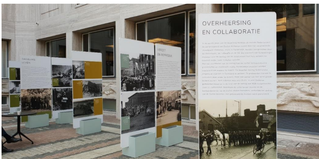
Panelen in provinciehuis Gelderland

Vanuit de burgemeester van Ede hebben we de vraag gekregen of het Historisch Museum Ede een 50 tal panelen zou willen plaatsen over de oorlog en de bevrijding van Gelderland. Deze panelen hebben eerst in het provinciehuis van Gelderland gestaan alvorens ze, onder leiding van het Historisch Museum, in Cultura zijn geplaatst. De verhalen en foto's geven een indringend beeld van het verloop, het leven en de bevrijding van Gelderland in de Tweede Wereldoorlog.