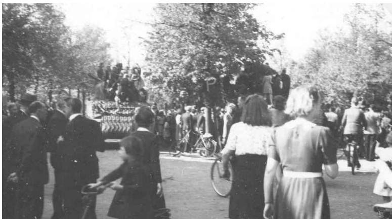
Bevrijding van Ede 17 april 1945 Oude Markt, GA26146

2020 Is het 75 jaar geleden dat het grootste deel van Nederland, waaronder de gemeente Ede, bevrijd werd. In heel Nederland werd daar aandacht aanbesteed. Ook het Historisch Museum Ede wilde hier groots bijilstaan met een programma dat in samenwerking met Militair Historisch Platform, Luistermuseum Bennekom, Museum Lunteren, Het Tegelmuseum in Otterlo, Vliegveld Deelen en Cultura Erfgoed tot stand kwam. Ieder museum zou stil staan bij de bevrijding van zijn dorp/gebied.