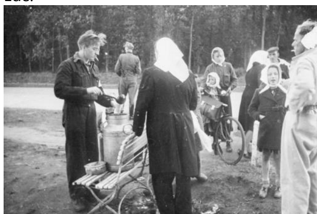
Evacués op de weg naar Ede september 1944

In het kader '75jaar Ede Bevrijd!' stond het Historisch Museum Ede stil bij de evacués in Ede die eind 1944 door de Edese bevolking zijn opgevangen. De evacués kwamen uit de dorpen langs de Rijn en Arnhem. Deze plaatsen werden ontruimd door de Duitsers naar aanleiding van operatie Market Garden van de geallieerden. De lezing vond plaats in de Foyerzaal in Cultura. De zaal zat vol met 45 toehoorders, zowel Edenaren als toehoorders wiens ouders als evacués onderdak hadden gevonden in Ede.