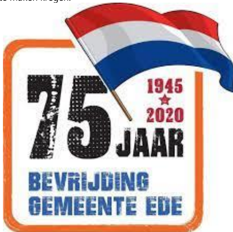
Logo 75 jaar Vrijheid Ede

Daarnaast werd het werken ook anders. Voor onze vaste medewerker betekende dit thuiswerken. Gezien veel van onze vrijwilligers vallen onder de kwetsbare doelgroep moesten zijn ook thuis blijven. Een klein aantal wilden graag ook thuis voor het museum aan de slag en die konden wij ze, dankzij de huidige techniek, de mogelijkheid geven om voor het museum actie te zijn. Zodra het kon, is er met een strikt rooster weer op kantoor gewerkt. De bezetting werd maximaal drie personen per dagdeel, zodat er rekening kon worden gehouden met de 1,5 m. afstand. Als museum zijn we heel trots op allen die voor ons werken en hoe ze zich vol hebben ingezet voor het museum en zijn omgegaan met de nieuwe uitdagingen waar we mee te maken kregen.